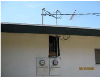
La casa de calidad inferior con alambrado peligroso