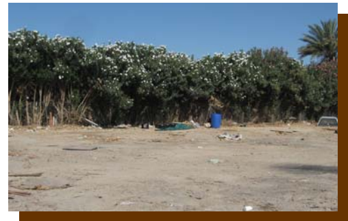
Un cambio drástico en este parque de casas móviles