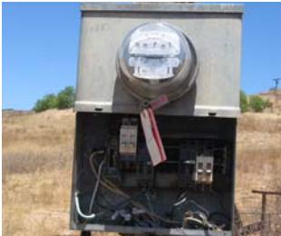
Manipulando el medidor eléctrico puede llevar a fuego, heridas, o a la muerte