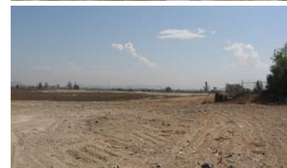
Se limpió una propiedad que poseía bienes raíces