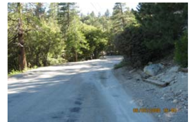
Esta área tuvo un derrame grave de cemento