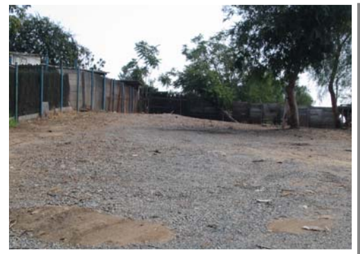
Una vez esta propiedad estaba llena de basura y cubierta de hierbas, ahora luce completamente limpia