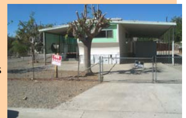
¡En esta propiedad el arrendatario fue desalojado, se lleno un hoyo de concreto, fueron cortadas las ramas y toda la basura fue removida!