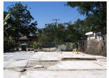
El propietario derribó esta estructura ilegal