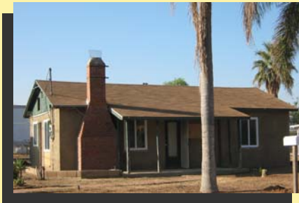
Los vecinos disfrutaban de ver esta casa restaurada

Las casas que preocupan y han sido abandonadas en el Condado de Riverside han alcanzado proporciones épicas. A menudo cuando los Oficiales de Code Enforcement se contactan con los bancos, prestamistas o titulares, sus peticiones para mantener la propiedad de una manera que sea consecuente con las casas que rodean y son ocupadas tienden a ser ignoradas. De vez en cuando, personas que compran casas en ejecución de juicio hipotecario ponen una cantidad mínima de esfuerzo para arreglar la propiedad. El Oficial Romero manejó un caso de aplicación de código que tuvo un resultado ligeramente diferente. Según Romero, "La propiedad era posesión bancaria y recientemente había sido vendida en una subasta". Cuando el Oficial Romero hizo contacto con el nuevo propietario, le fue bastante placentero que estuvieran de acuerdo en obtener permisos de rehabilitación para reparar los defectos estructurales. "La casa fue de calidad inferior y un fastidio peligroso al vecindario," recuerda el Oficial Romero. El nuevo propietario va en camino en moldear a su manera su nueva propiedad y dándole un aspecto fresco y nuevo. Gracias al nuevo propietario, los vecinos en esta calle ahora tendrán una razón buena para voltear y mirar como avanza el proceso de restauración de esta hermosa casa. Para más información con respecto al Programa de Residencias Penadas y Abandonadas, contacte su oficina local de Code Enforcement o visite nuestro sitio en www.foreclosureregistration.org .