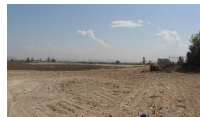
Se limpió una propiedad que poseía bienes raíces